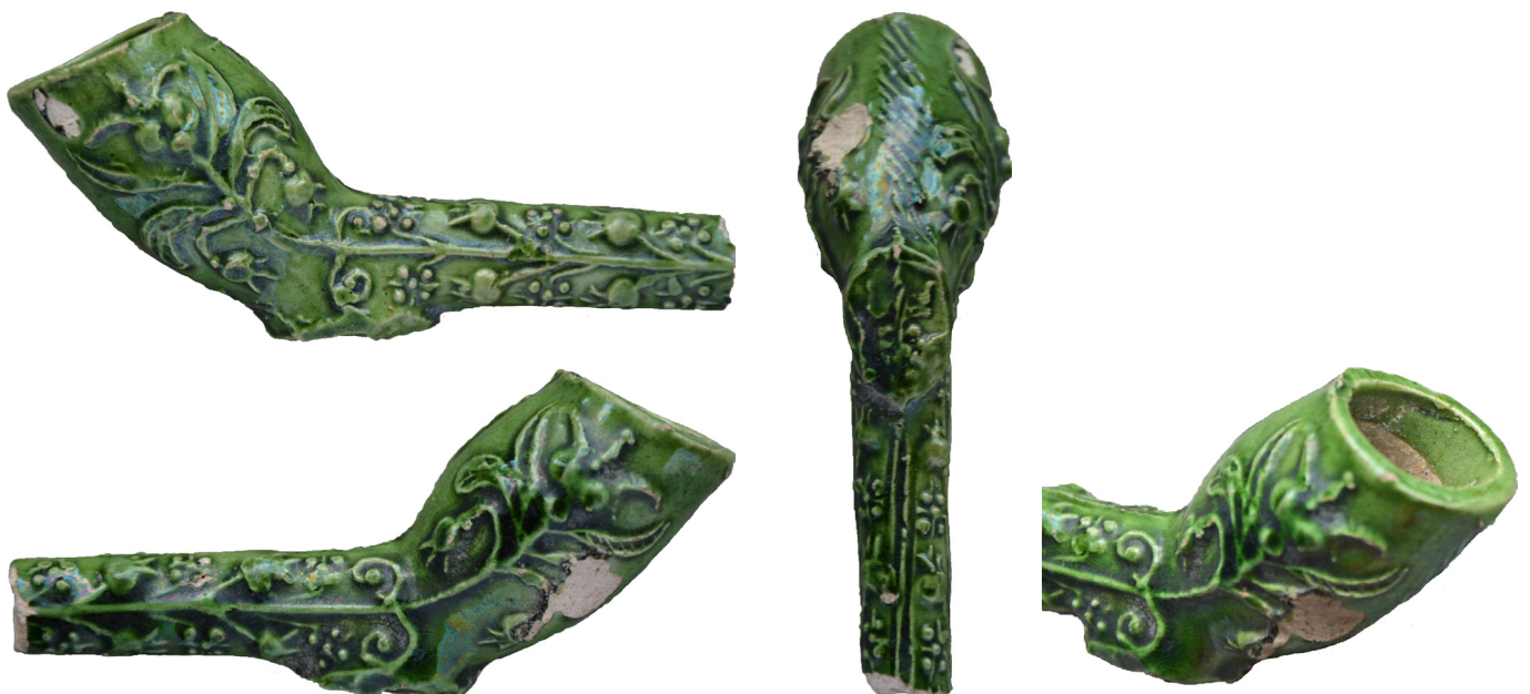
Afb. 1a-d. Het in Uithoorn gevonden pijpfragment.

Aanknopingspunten voor de herkomst van deze pijp blijken echter te vinden in diverse publicaties