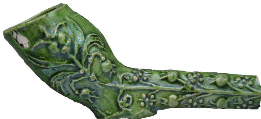
Afb. 2. Het in Uithoorn gevonden pijpfragment.