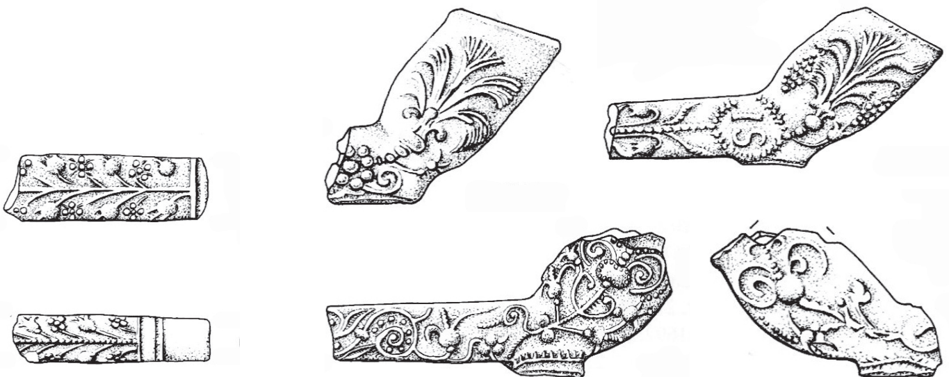
Afb. 5-6. Steelfragmenten uit Karlstadt (boven) en Augsburg (onder). (Uit: Mehler, 2010, p. 378)

Helaas is er geen exacte gelijke uitvoering van de ketelversiering te vinden. Geen van de in de categorie C5 door Mehler afgebeelde modellen, of van de modellen in afbeelding 5 t/m 10 is gelijk aan de vondst bij Uithoorn, maar de diverse florale versieringen zijn zeer vergelijkbaar. Vrijwel alle geraadpleegde bronnen spreken van het regelmatig voorkomen van de