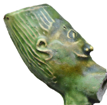
Afb. 3. Nederlands pijpfragment, Jonas met groen glazuur.